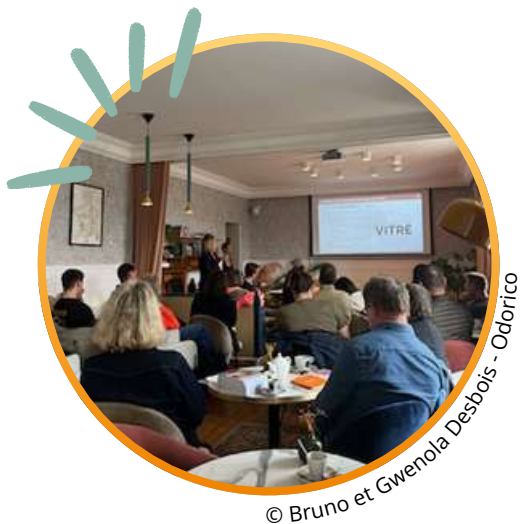
© Bruno et Gwenola Desbois - Odorico